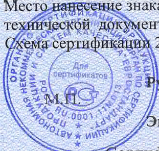
Схема сертификации 2.

Место нанесения знака соответствия: на изделии, на таре (упаковке), на сопроводительной технической документации.