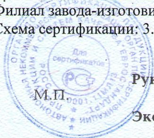
Схема сертификации: 3.

Филиал завода-изготовителя: "Ensto Ensek AS", Paldiski mnt. 35/4A, 76606 Keila, Estonia, Эстония.